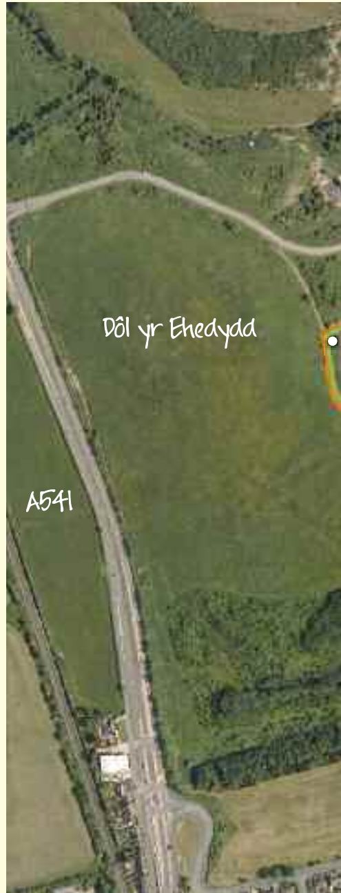
Teithiau Cerdded Gwersyllt